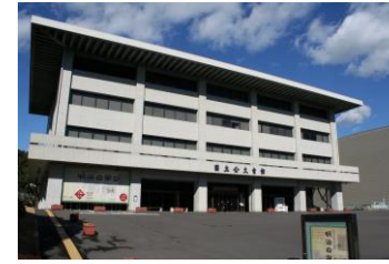
国立公文書館外観

平成27年(以下同)1月23日 当館職員2人が東京都千代田区にある国立公文書館で研修しました。閲覧室・修復室・書庫を見学したほか、修復作業やデジタルアーカイブズ等について意見交換をしました。