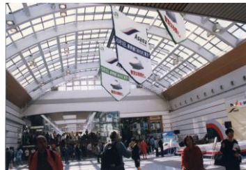
長野新幹線開業にあわせ建て替えた長野駅