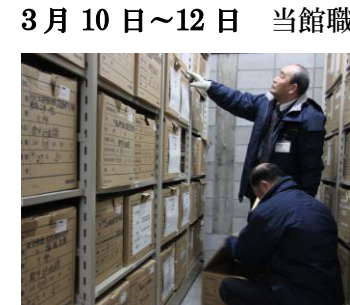
長野市役所地下書庫

3月10日~12日 当館職員3人が長野市役所第二庁舎地下書庫で、保存年限が終了する公文書の評価選別を行いました。5年・10年・30年保存のそれぞれの公文書が3月末で満期を迎え、当館へ移管するため3日間に分けて作業を行いました。27年度初めに移管予定です。