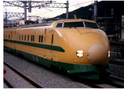
新幹線検査車両(ドクターイエロー長野駅入線)

長野自動車道等の高速道路網や競技会場である白馬、志賀高原等を繋ぐオリンピック道路の建設など、オリンピックの開催に伴い長野市周辺の交通網は大きく変わ