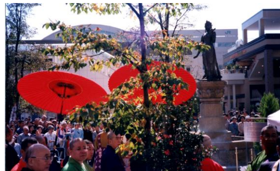
建て替え中に移転していた如是姫像もこの日駅前にお戻りになり、お魂入れの儀式が行われた