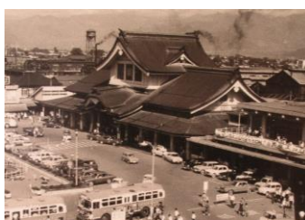
懐かしい仏閣型の長野駅舎(昭和42年撮影)