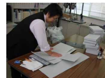
箱作り作業・箱詰め作業の様子

2月17日 水内村役場文書が公開となりました。平成25年度から整理を進めていた文書ですが、約2,000点と大量で、時間がかかりました。