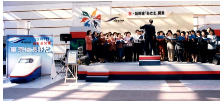
あさまの開業を記念した祭典の様子

こんなときにはご相談ください。 ・古い土蔵などを取り壊すので、古文書や古記録、古書を寄贈・寄託したい。 ・所蔵資料の保存・活用を図り、後世に伝えたい。