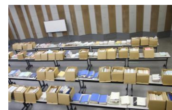
城山分室大会議室を使い分類作業

1月27日 旧豊野町役場文書の第3次分の整理を開始しました。当館職員6人で約1,000点もの資料を、2日間にわたり年代別に並び替える作業を行いました。