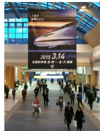
装いを新たにした長野駅と駅ビルMIDORI。金沢延伸による長野への集客力に注目したい

そして今年3月14日、新幹線は金沢まで延伸し「北陸新幹線」として開業しました。昭和48年(1973)の整備計画決定から40年の歳月を経て、ようやく北陸に新幹線が開通したのです(金沢以西も整備中)。長野駅も全面改修されました。駅ビルが拡張され、善光寺口ファザードも大庇(ひさし)が印象的な和モダンテイストに装いを変え、北陸と首都圏を繋ぐキーステーションとして新たなスタートを切るようになりました。