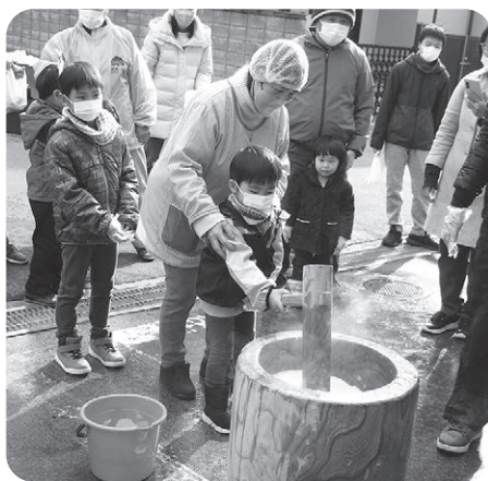
力いっぱい餅つき

した。付き添ってきた保護者も参加してつきあげられた熱々の餅は、きな粉とあんこに味付けられ、一足早いお正月を各々味わいました。 一年を通して、子どもからお年寄りまで、年齢の垣根を越えて、“集まれば楽しい!” 交流の機会を継続していきたいと思います。