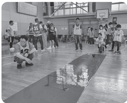
四ツ石スマイルボウリングチーム

初めてスマイルボウリングをやりました。むずかしかった事が2つありました。1つ目はゲートを通すことです。初めの2回は通りませんでした。初めはゲートを通すことが、ゆっくりやさしく転がした。ゲートを通って、「やったー、できた」とうれしくなりました。そして、ピンがコロコロとたおれました。