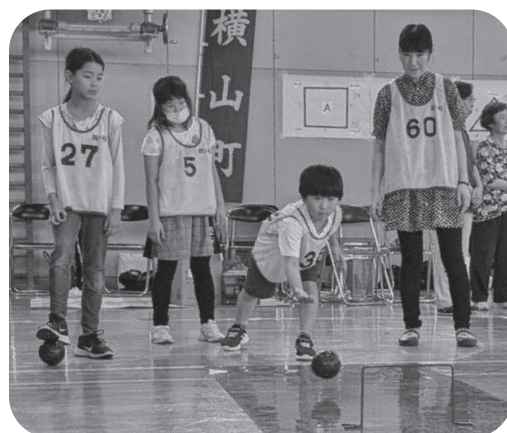
ボウリングはゆっくりやさしく転がします

2つ目は残り1つになったピンをたおすことです。ゲートを通っても方向が合っていないとたおれません。最後の1本を何としてもたおすぞ!!と思いつつ転がしました。チームのみんなが、「すごい。ナイス」と声をかけ合いながらやりました。