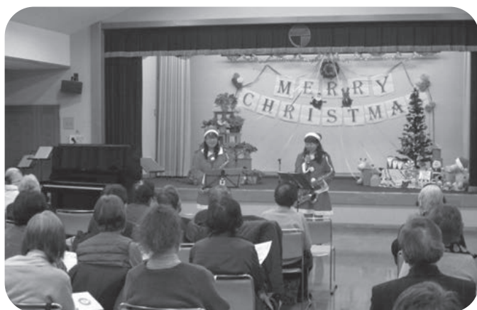
会場は幸せな空気に包まれました

終わりに来場者全員でタイトルに冬が付く楽曲を2曲合唱し、一足早いクリスマスコンサートを楽しんでいただきました。