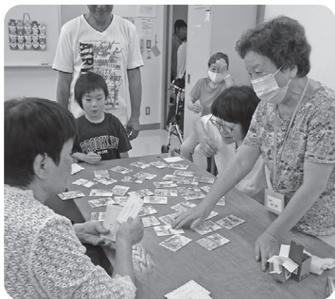
かるた取りで和気あいあい

まず、「本郷夏祭り」。子どもからお年寄りまで楽しめるように、水ヨーヨー・折り紙・かるた・輪投げ等のイベントを催し、会場は約210人の笑い声や歓声で溢れました。