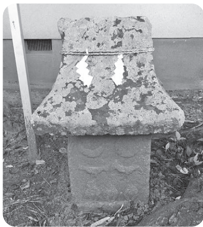
返目公民館庚申塔