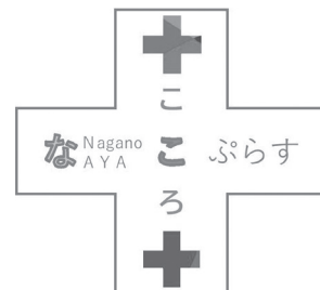
AYA世代へのメンタルヘルスケア対策を周知する市のロゴ