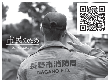
ホームページやYouTubeで消防職員の募集をPRしている

市には、各種大会で結果を残す若手職員も多数いる。労働環境の改善や消防職員としての魅力ややりがい積極的にPRするよう要望した。