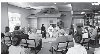
令和7年9月に開催された「エンジン01 in 加賀温泉」の様子

●令和8年度に開催されるエンジン01文化戦略会議は、子どもたちにとっても本物に触れることができるイベントであることから、プログラム構成等の充実と積極的な広報活動を要望した。●請願第2号については、賛成少数で不採択とすべきものと決した。