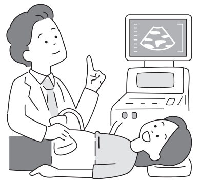
令和8年度から始まる胎児心エコー検査の費用助成