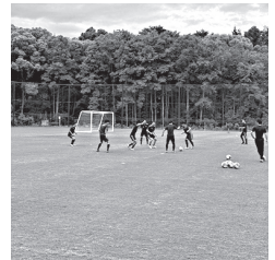
天然芝グラウンドで、サッカーチーム等の合宿に活用されることも期待されている

A 測量や地質調査の結果を受けた実施設計により、ピッチ、アップフィールドの安全性を確保するため法面のセットバックや、雨水排水設備等が必要となった。また、地元住民や環境省、Jクラブ等との交渉により追加となった工事もある。計画には飯綱東山麓線交差点改良工事をはじめ、大座法師池周辺の観光施設の整備も含まれており、地元住民の皆様の期待にも応えていきたい。