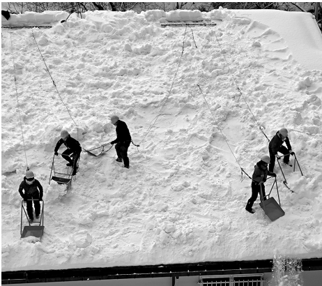
命綱固定アンカーを使用した鬼無里地区雪かき道場の様子

答 令和7年9月から、雪下ろし型克雪住宅整備事業補助金の補助率を二分の一から三分の二に、補助金上限を八万円から二十万円に引き上げた。また、令和8年度からは、支援員報酬を時給二千円から二千七百元に増額する。これまで同補助金の対象を、戸隠・鬼無里地区の非課税世帯の一部としてきたが、その区分をなくし、両地区の全世帯に拡大する。