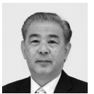
公明党 松井 英雄