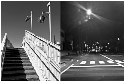
県内で初めて若里地区に導入された、降雨・夜間に優れた反射効果を発揮する路面標示材（右写真）と新たな融雪設備