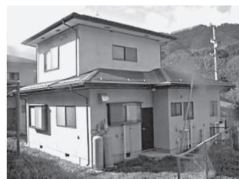
特定公共賃貸住宅の用途変更を行う川口団地

●中心市街地の整備については、都市機能の更新等が見込める公共性の高い事業であるが、このうち、長野駅前B-1地区の再開発事業を進める準備組合では、昨今の建設工事費の高騰による事業採算性への影響などもあり、事業計画の作成や関係者との調整に時間を要しているため、早期の組合設立及び事業着手に向け、事業計画に応じた柔軟かつ適切な支援を行うよう要望した。●一部特定公共賃貸住宅の用途変更については、入居資格に所得要件があり家賃が所得に応じ設定される特定公共賃貸住宅のうち一部を、所得要件がなく家賃が定額の定住促進住宅として活用するため、居住者間で家賃に差が生じることから、不公平感を生じさせないため、居住者へ丁寧な説明を行うよう要望した。