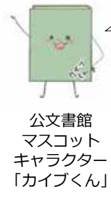
公文書館 マスコット キャラクター 「カイクくん」

記憶は消えてしまふけれど、記録は残るんだよ。記録を残す公文書館は歴史を残すところなんだ。