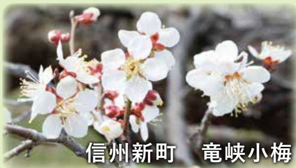
信州新町 竜峡小梅