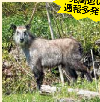
▲カモシカ 角があり面長で、ややスリム。静かにたたずんでいる。