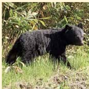
▲ツキノワグマ 耳が丸くて鼻先が短い。首が太く、胴体はずんぐりしている。