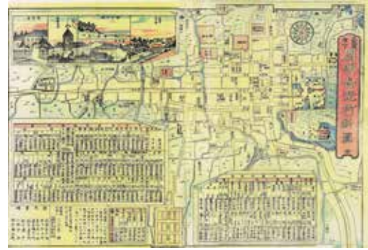
▲開明長野町新図(明治11年)

共通 ▼場所／公文書館 ▼申し込み／5月11日(月)9時から電話で公文書館へ ※1回からの参加が可能です。