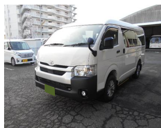
運行車両イメージ