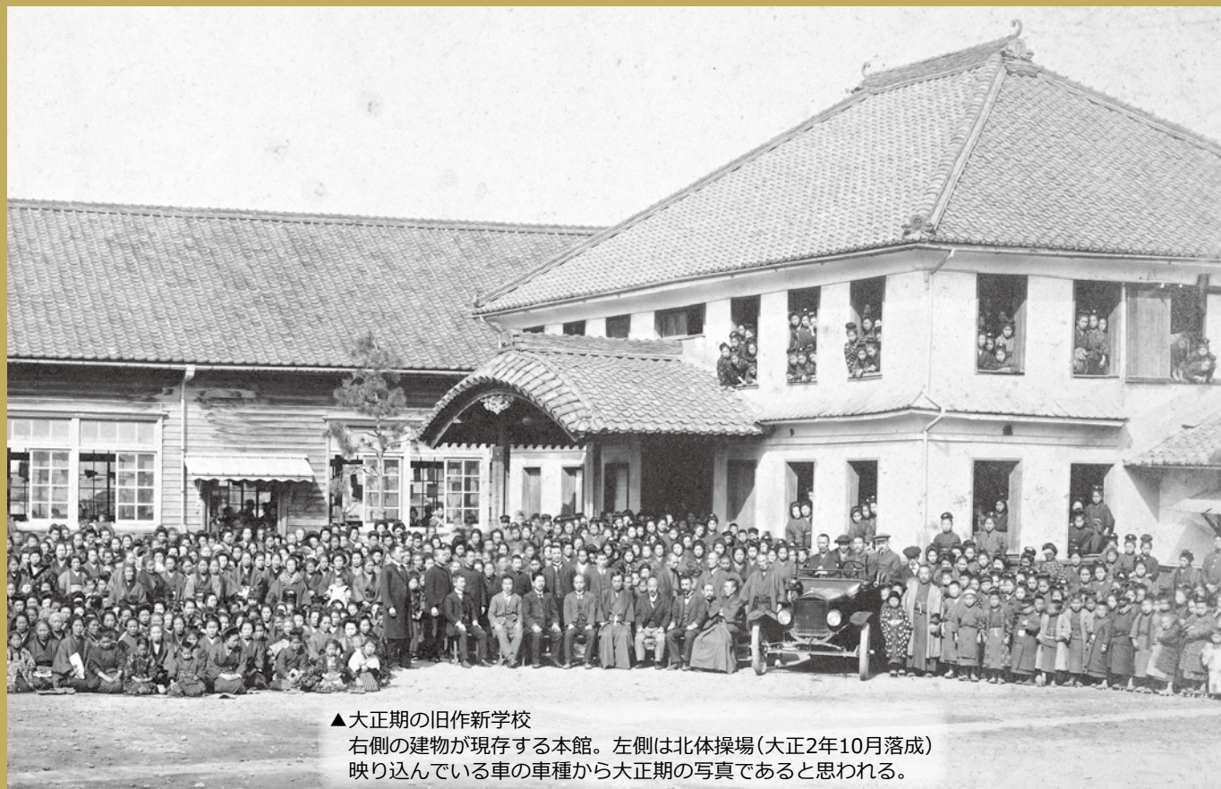
▲大正期の旧作新学校 右側の建物が現存する本館。左側は北体操場(大正2年10月落成) 映り込んでいる車の車種から大正期の写真であると思われる。