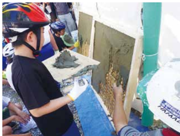
▲壁を塗る左官作業を体験