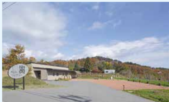
▲ 景観奨励賞 有旅ワイナリー

景観への関心を深め、より良い景観を創造していくため、優れた景観の形成に寄与している建築物や工作物、団体などを表彰しています。