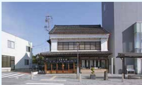
▲ 景観賞 和の美 植木商店