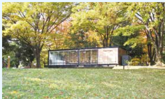
▲ 景観賞 インスパーク若里公園