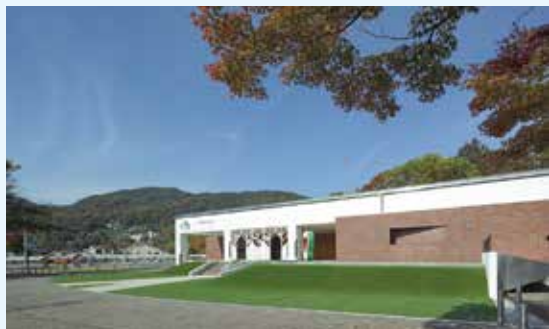
▲ 景観賞 ながのこども館ながノビ！