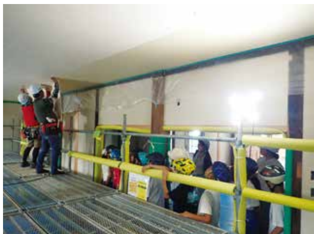
▲和紙を5層重ねる紙張り天井の施工現場見学会

工事中、同校の児童の皆さんには、工事の見学や一部作業の体験などを通じて、旧作新学校本館について学んでもらいました。今後は、同校の授業やクラブ活動といった学習の場、地域の皆さんとの交流の場などに使用される予定です。