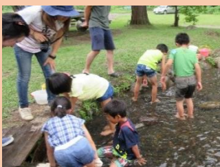
低学年はつかみ取り

今年の三世代ふれあいハイキングは、信濃町の「フィッシングランドはなおか」で開催しました。自然豊かな高原で、魚のつかみ取り・釣り・バーベキュー等で過ごし、楽しい夏休みの思い出となりました。