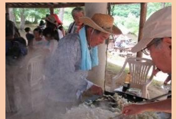
小池会長の焼きそばも大好評