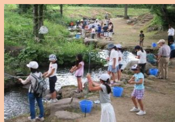
高学年以上はフィッシング