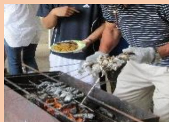
釣った魚はバーベキュー