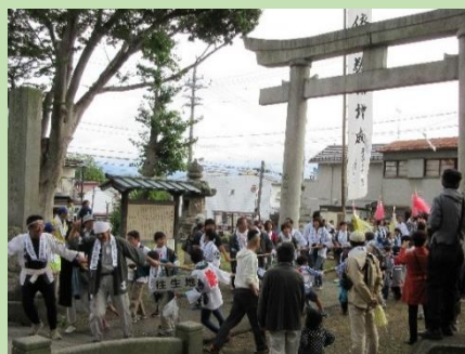
「宮入」 湯福神社境内へ