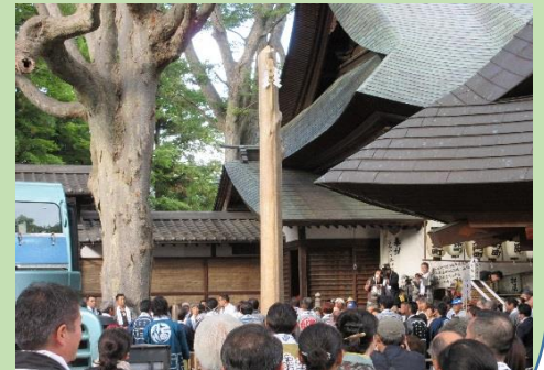
社殿西側に「二之柱」東側に「一之柱」が無事建ちました