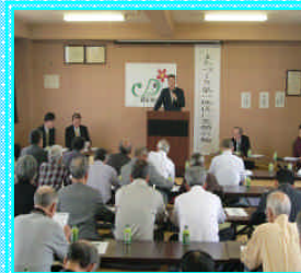
防災マップ講習会の様子

主に、防災マップの作成・白線作戦実施（安全・防災部会）、健康づくり講座開催・ウォーキングの実施（健康・福祉部会）、アメリカシロヒトリ防除対策・ゴミ処理問題講演会開催（環境部会）、スポーツ大会開催・地域の子育て講座開催（教育・文化部会）など地域の住民の理解と参加を得て順調なスタートをしました。