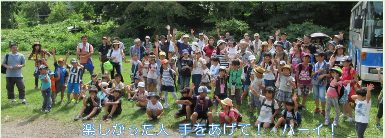
楽しかった人 手をあげて! ハーイ!