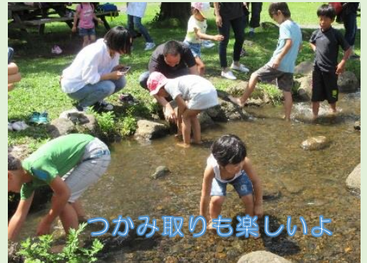
つかみ取りも楽しいよ