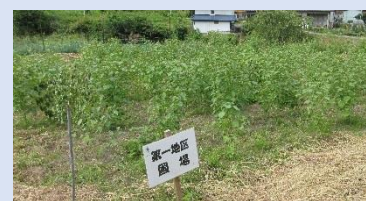
生育の様子(9月初旬)