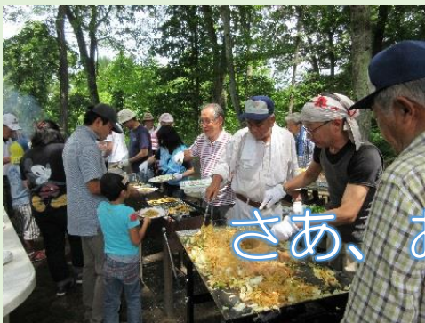
さあ、お待ちかねの BBQ!