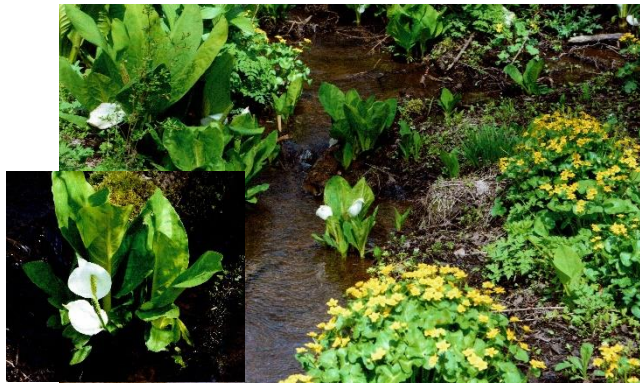
中条地区菜の花畑とこいのぼり 牟礼の水芭蕉