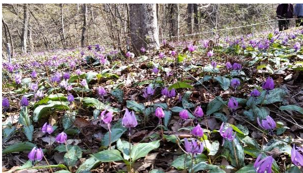
新諏訪「春の妖精 カタクリ」の群生地