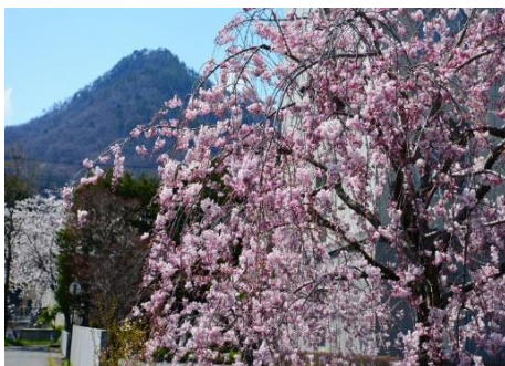
西長野自治会館の小彼岸桜