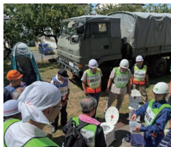
簡易トイレの組立