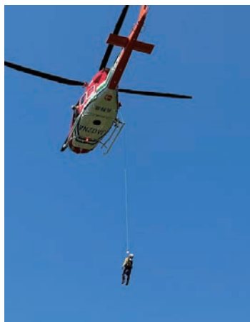
消防防災ヘリ「アルプス」による ホイススト訓練