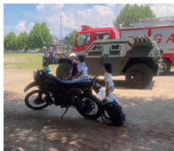
偵察用オートバイ 軽機動装甲車