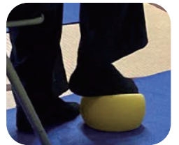
足裏・足指ほぐし