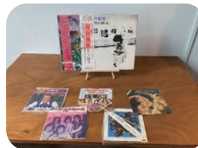
皆さんの持ち寄ったレコード