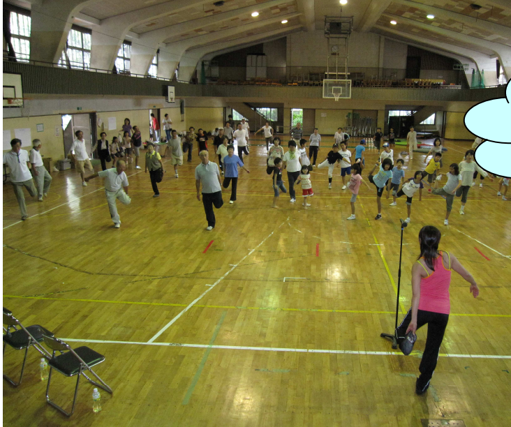
第四地区の“老若男女”が楽しみました

本年度も、第四地区全体で様々な活動に取り組んでいます。ここに活動の幾つかを紹介します。