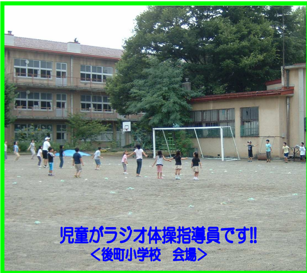
児童がラジオ体操指導員です!! 〈後町小学校 会場〉

恒例の夏季ラジオ体操が、7月末～8月上旬の約10日間、後町小、妻科神社、日赤の3会場で行われました。子どもたちと保護者に加え、地域の大人の皆さんも多数参加し、3会場あわせて連日約100人、10日間ではのべ約1,000人が、音楽にあわせて体を動かしました。