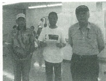
準優勝(妻科Aチーム)