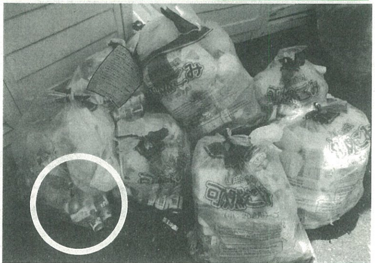
上の写真の中の白丸で囲んだ部分にガスボンベ缶がガス抜きしない状態で何十本と入っています