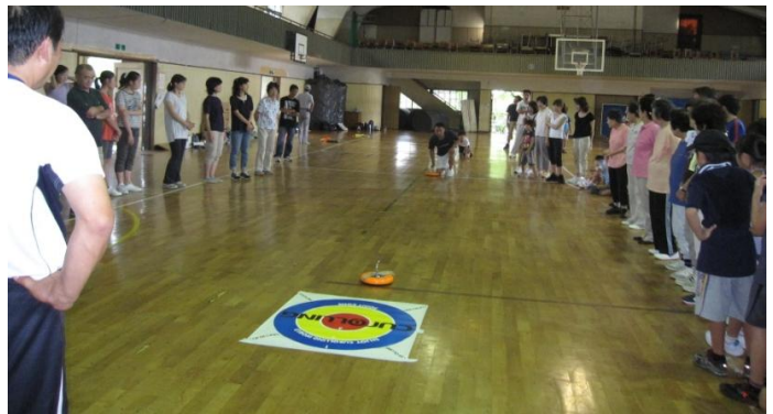
今年初登場のカローリング(体育館版カーリング) 全員で体育指導員の方からやり方を教わりました

今年はカローリングという初めての競技に挑戦！全員が初心者！小学生や女性チームの健闘が目立ちました。