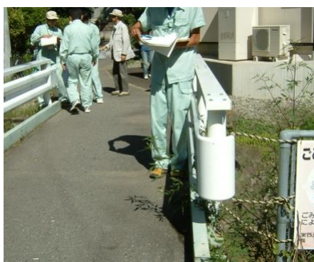
←写真左 ロープで応 急処置をし ている箇所