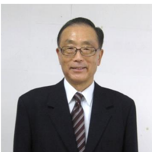
監 事 妻 科：宮崎 保夫 区長