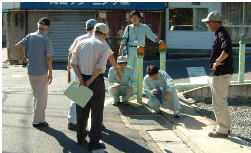
写真上下：側溝の水が集まって、あふれやすいところ

各町の区長は、毎年、地区の土木関係の要望を長野市に提出しています。土木関係とは道路、水路などの改良、維持補修や、ガードレール、カーブミラーなどの交通安全施設の整備などにあたります。写真は昨年度のもので、区長が長野市職員と現場を同行した際の様子です。