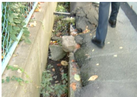
←写真左 アスファルトが崩れ落ちて いる箇所