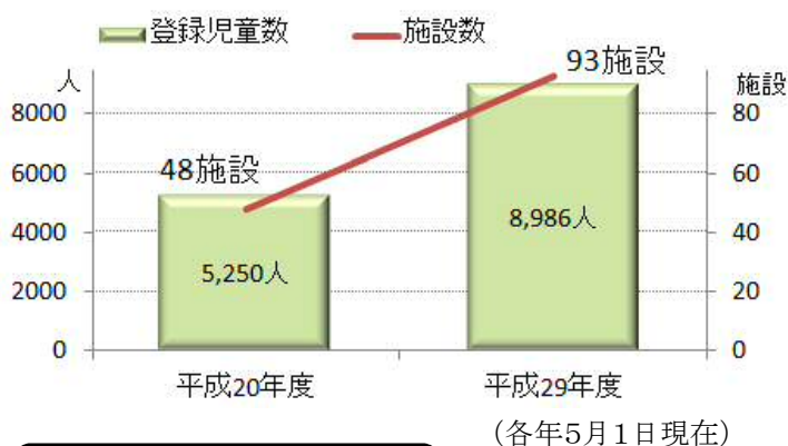
登録児童数と施設数の推移