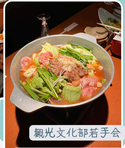
観光文化部若手会