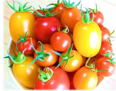
右上：圃場で栽培した中玉・ミニトマト色々