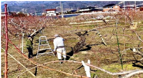
左上：剪定の指導を受けているところ