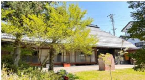
左下：管理運営する民泊施設