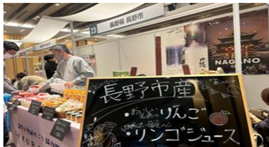
右上：協力隊全国サミット参加