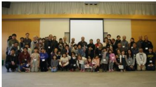
右下：移住促進活動の芋井移住者フェア