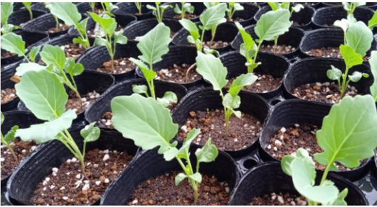
左下：播種したスティックブロッコリーの苗