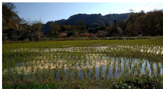
左上：長野市元協力隊の方との稲刈り（信級）