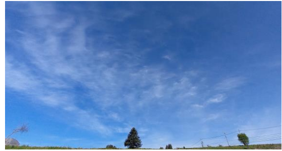
右下：いつも見ている圃場からの景色