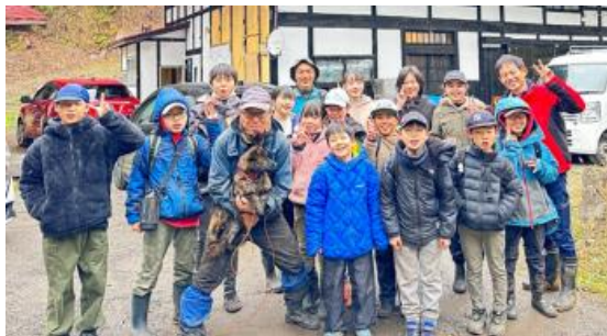
左上：地元小学生と葛の根掘り後に