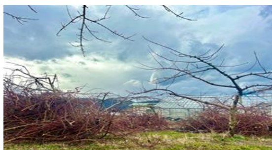
右下：剪定後の圃場と枝