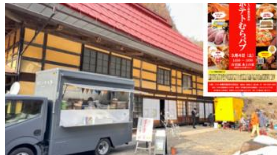
右上：「田舎に飲食店を！」の移動居酒屋