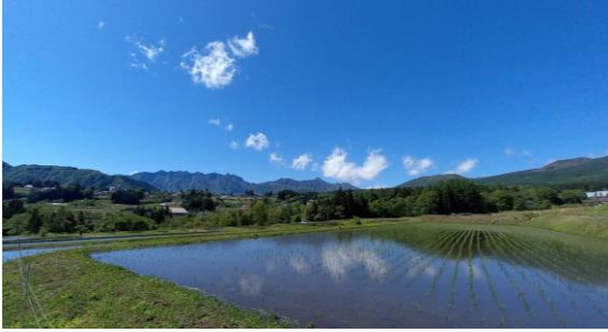
左上：田植え後に見上げた戸隠連邦