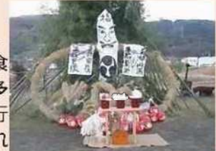
篠ノ井越の人形道祖神

市域では山地・盆地で多様な生活文化が育まれ、地域間の交流がなされてきました。山地・盆地の生産生業・商品流通を背景として郷土色豊かな食文化も発展し、おやきに代表される粉食は今も人々に親しまれています。多様な生活文化を背景にして、市域各地では多様な年中行事・祭礼・芸能が行われてきました。現在でも道祖神の祭、獅子舞、御柱祭などが盛んに行われ神社や地域の祭事にあわせた花火の打ち上げも見るすることができます。