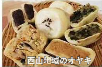
西山地域のオヤキ