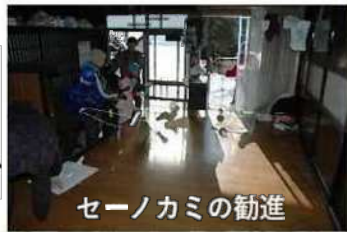
セーノカミの勧進

【主な構成文化財】 芦ノ尻の道祖神祭り、人形道祖神、小正月関係コレクション、えびす講花火、獅子神楽など