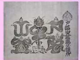
戸隠山から出されたお札

市域には、社会の様々な人々と結縁する開かれた霊場として、多くの人々の信仰を集めてきた善光寺を筆頭に、修験の聖地であり、水を司る神として全国に名が知られていた戸隠山や、近世に地域の修験者を統括していた皆神山など、多くの宗教的拠点が存在しています。また市域では近世、里修験や聖と呼ばれる宗教者たちが地域の人々の信仰を支えていました。