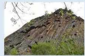
絡郷呂山の石切場

太古の昔、海だった長野市域は、その後の激しい地殻変動によって長野盆地と東西の山地からなる地域となりました。この地殻変動は市域に暮らす人々に湧水や温泉、石材といった恵みをもたらす一方で、地震や水害といった災害をもたらしてきました。