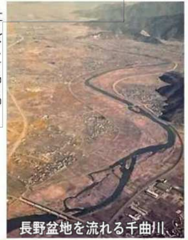
長野盆地を流れる千曲川

千曲川水系がもたらす恵みと脅威を受けてきた人びとの暮らしを伝える物や伝承からなる文化財群