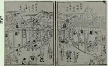
善光寺宿駅繁花茶店の図 『善光寺道名所図会』

長野市は長野県と新潟県との境界に当たる位置にあり、古くから内陸の山間地と日本海側をつなぐ交通の要衝でした。善光寺には古代以来、多くの参詣者が訪れ、その門前は様々な人々が行き交いました。近世になると北国街道が整備され、北信地域の大動脈となりました。近年では平成10(1998)年にオリンピック・パラリンピック冬季競技大会が開催され、世界中から多くの人々が市域を訪れました。