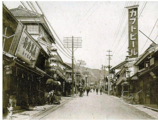
拡張前の中央通り(明治末)

長野市の中心である善光寺表参道(中央通り)。古くは、北国街道と呼ばれてました。そのため、北陸地方との繋がりを感じさせるものが中央通り沿いには残っています。北陸とのつながりを詳しく教えてもらいます。