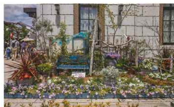
八十二長野銀行大門町支店前