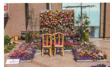
ホテル JAL シティ 長野前

◎八十二長野銀行大門町支店前／花とポタジェと小さな幸せ（Noriko's Garden 稲葉典子）