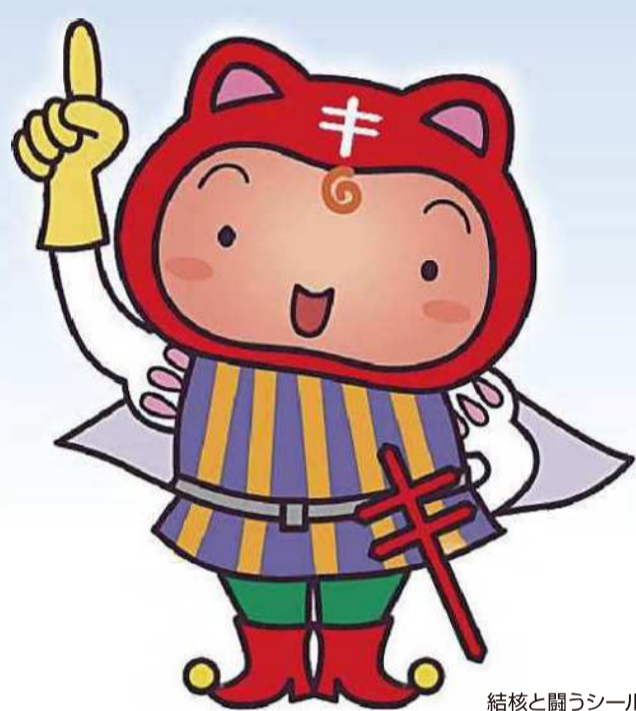
結核と闘うシールぼうや