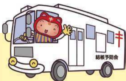
結核と闘うシールぼうや