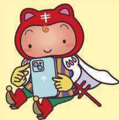
結核と闘うシールぼうや