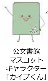
公文書館 マスコット キャラクター 「カイクくん」

記憶は消えてしまふけれど、記録は残るんだよ。記録を残す公文書館は歴史を残すところなんだ。