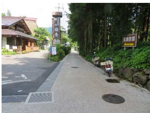
令和 4 年度工事 工事完了状況