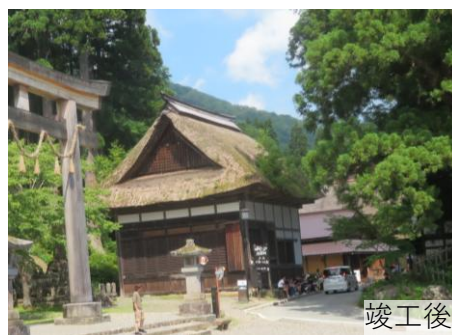
横大門通り（西から）