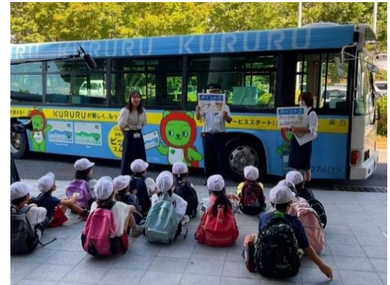
～「バスの乗り方教室」～