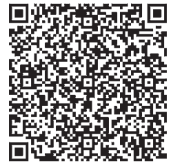
申込二次元コード

右記二次元コードを読み込み申込フォームから申し込むか、下記の申込書に必要事項を記入し、郵送またはFAXで運営事務局へお送りください。 申込多数の場合、抽選とさせていただきます。 抽選問わず、参加の可否については、運営事務局からメール、電話、書面のいずれかにて、申込期限(7月14日)から1週間以内に通知いたします。 ドメイン「@actech.ne.jp」が受信できるようにメール設定してください。