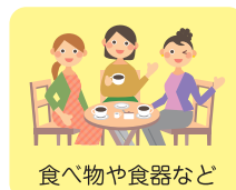
食べ物や食器など