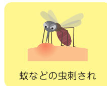
蚊などの虫刺され