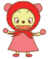
レッドリボンちゃん (長野市エイズ啓発イメージキャラクター)