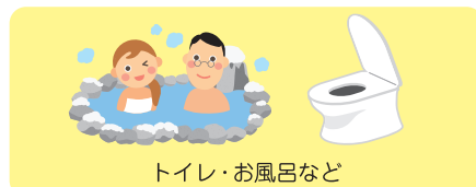
トイレ・お風呂など