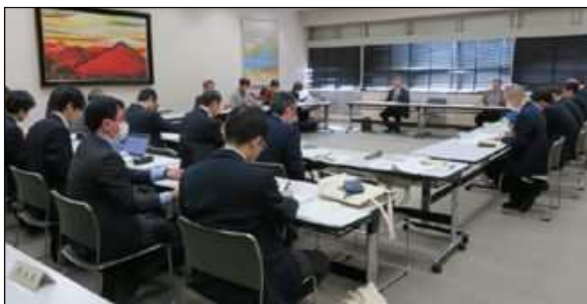
長野市歴史的風致維持向上協議会 (R8.2.5)