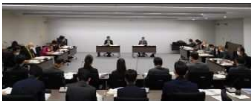
長野市歴史的風致維持向上協議会 (R6.1.18)