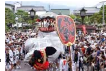
弥栄神社の御祭礼

善光寺周辺には弥栄神社や善光寺三社(湯福神社、武井神社、妻科神社)をはじめ、歴史ある寺社が点在しており、善光寺周辺に形成された歴史的なまちなみの中で、地域住民により伝統的な祭礼が受け継がれています。