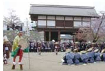
松代城跡で行われる大門踊り

真田十萬石の松代城下町には、松代城跡や武家屋敷地等に水路がめぐっており、泉水(池)のある庭園をもつ歴史的建造物が残っています。また、松代城下町と北国街道松代道で結ばれる若穂川田地域には、歴史的まちなみと火防信仰、祭礼とが一体となって生活に深く浸透した風致が見られます。