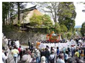
戸隠神社の式年大祭

戸隠神社では、数え年で7年に一度の丑と未の年に、式年大祭が行われます。期間中は、中社・宝光社間の神輿渡御をはじめ、太々神楽などの様々な伝統行事が催されます。