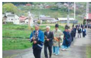
白髭神社の祭礼(神楽)

鬼無里では白髭神社の祭礼、鬼無里神社の祭礼、諏訪神社の御柱などがあり、地域に暮らす人々以外にも、大学生など地域内外の若者から高齢者まで幅広い世代が参加しながら、現在も継承されています。