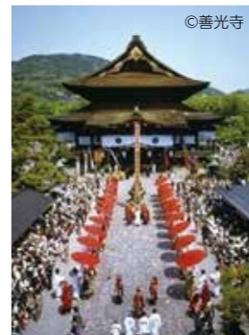
御開帳における中日庭儀大法要

善光寺では、数え年で7年に一度の丑と未の年に前立本尊の御開帳が催されています。期間中は、「中日庭儀大法要」をはじめ、様々な法要等が行われます。