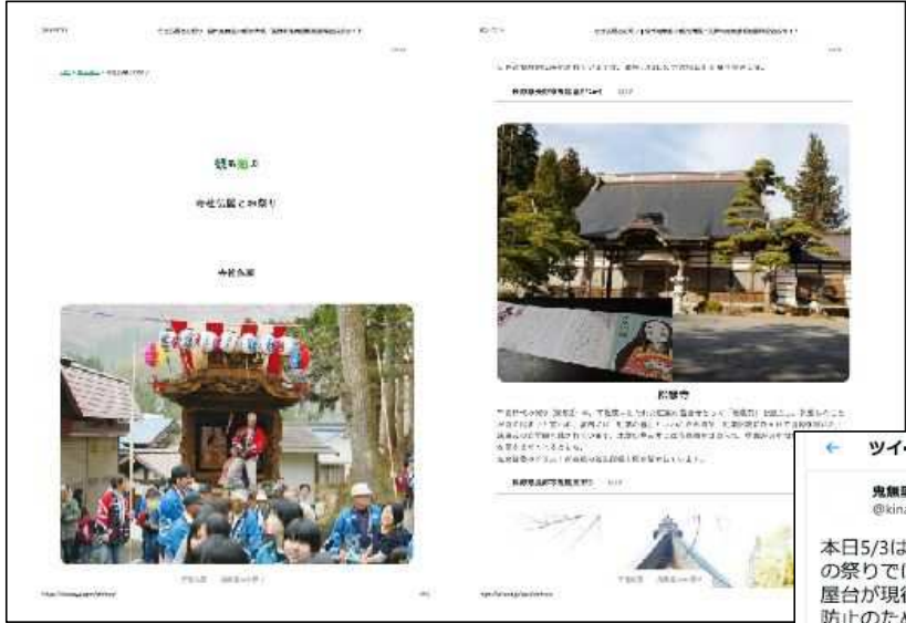
鬼無里観光振興会ホームページでPR活動