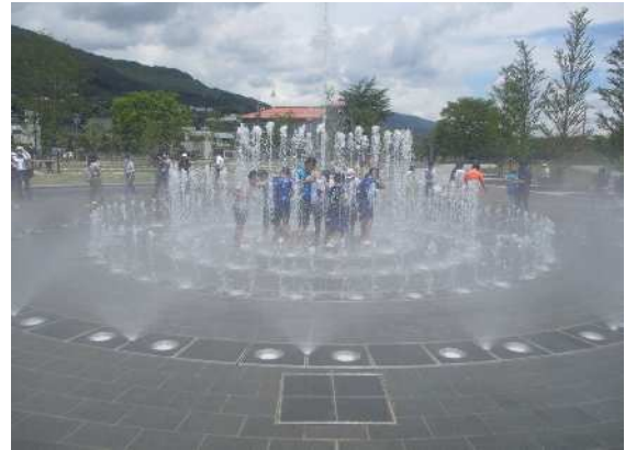
開園した城山公園噴水広場(令和3年7月7日)