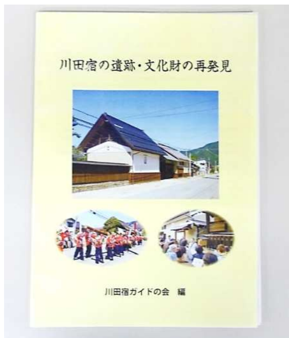
冊子「川田宿の遺跡・文化財の再発見」