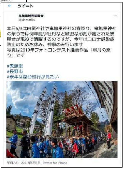
鬼無里観光振興会Twitterも随時更新しPR活動