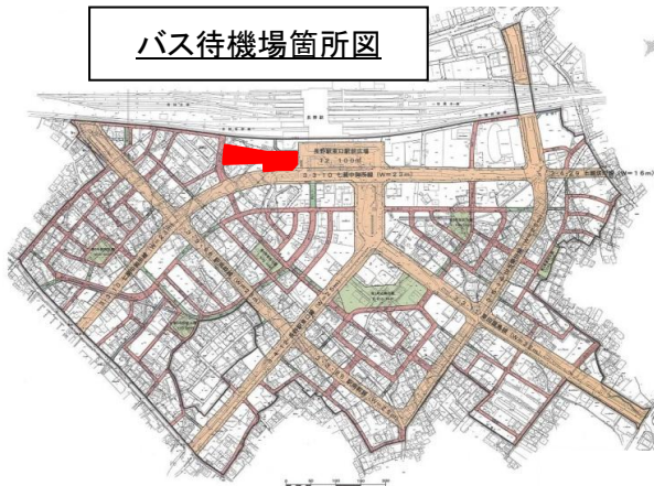
バス待機場箇所図