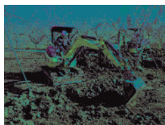
農地堆積土砂の排土作業