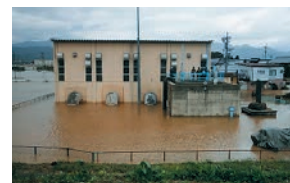
排水機場の被災状況（篠ノ井）