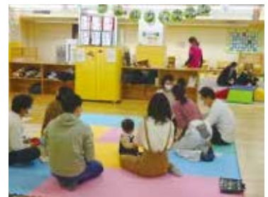
令和4年度開催の様子