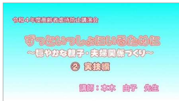
* 実技編 32分程度