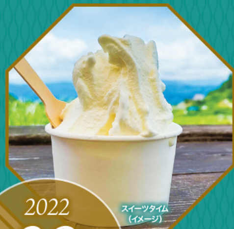
スイーツタイム (イメージ)

魅力ある暮らしに触れ、出会いを楽しむ。 長野圏域で移住・婚活を考えてみませんか？