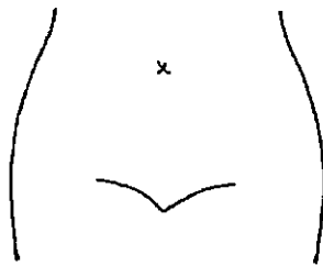
（ストマ及びびらんの部位等を図示）