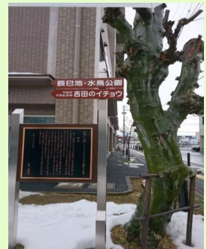
愛が成就するという、縁起のいいプラタナス