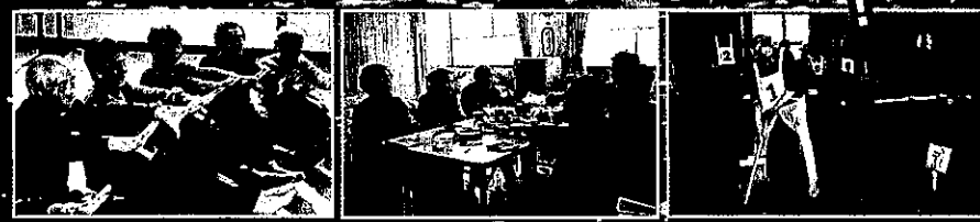
体操ですっきりお部屋でおしゃべり、ゲームボールでハッスル!

ご近所さんといのびり天然温泉 ゆつたり、のびり天然温泉 黄金の湯 松代温泉に 泊まろう！