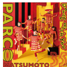
松本PARCOとの産学連携 (松本PARCO35周年 衣装デザイン)