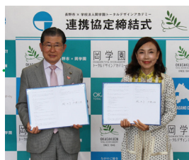
長野市との連携協定 (専修学校初)

長野市や長野県、長野県商工会議所連合会・長野県商工会連合会と、デザインにおける連携協定を結び、様々なプロジェクトや企画に参加することで、長野ブランドの発展と地域活性化に寄与しています。