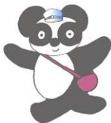
おでかけパスポートPRキャラクター「おでパンダ」