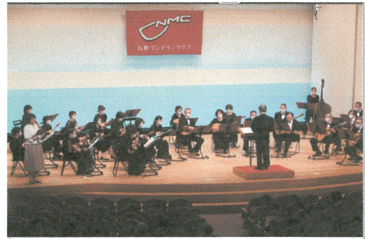
(写真説明1) コンサート