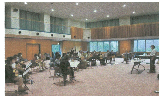
(写真説明4) 練習風景