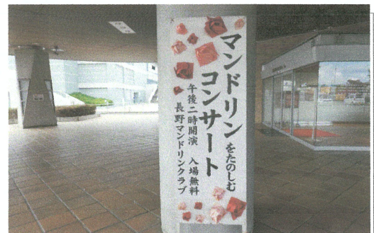
(写真説明3) ホール入口看板