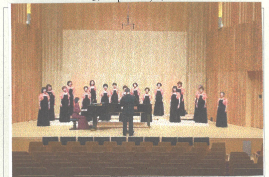
(写真説明2) 第1ステージ