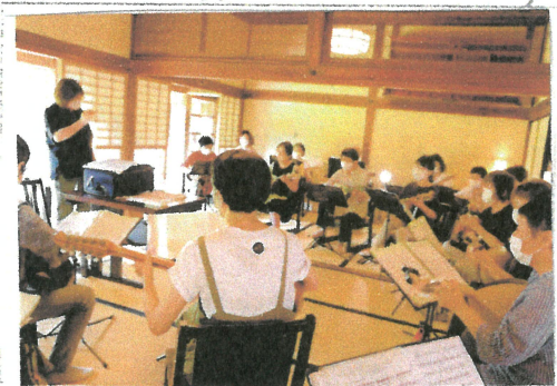
(写真説明3) 令和4年8月27日(土)合宿 松代町 手田商家