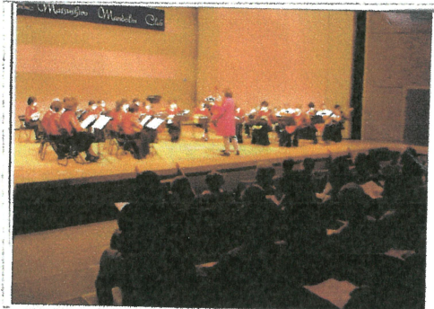
(写真説明1) 演奏会当日