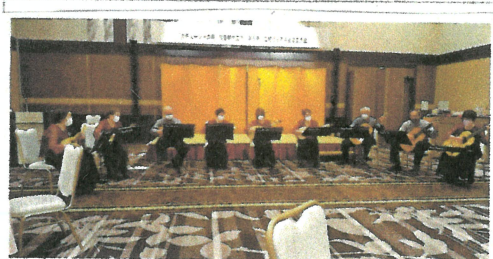
(写真説明4) 令和4年5月30日(月)「カク2-1の唄」 知音者市交流会議にて演奏 (口伝ホテル長野)