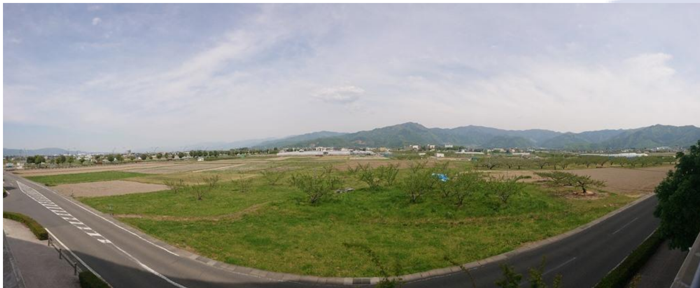
南長野運動公園東側の整備予定地全景(パノラマ写真)