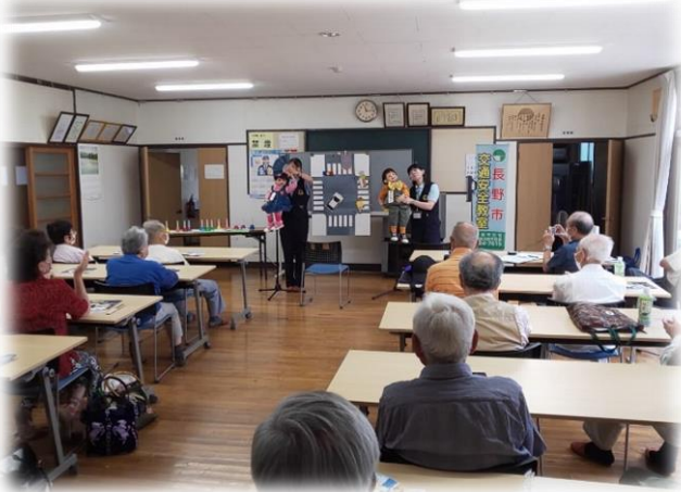
【世代に応じた交通安全教室の実施】 (地区老人クラブ)