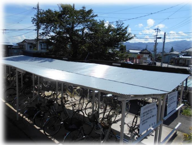
【駐輪場屋根の修繕】 (稲荷山駅自転車駐車場)