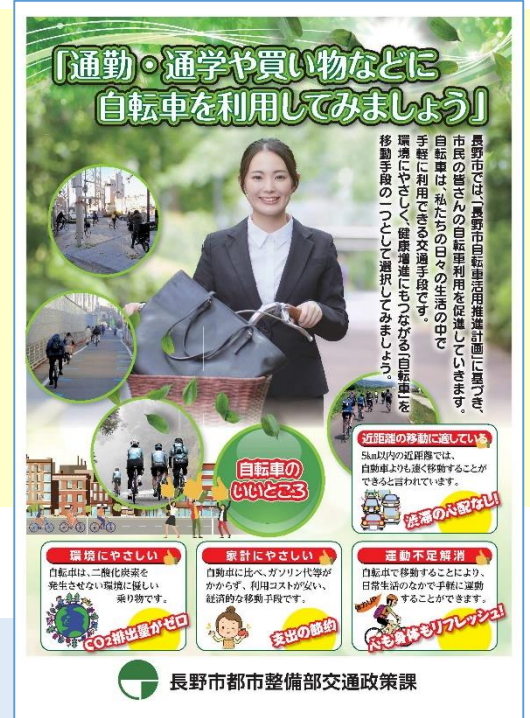
長野市都市整備部交通政策課