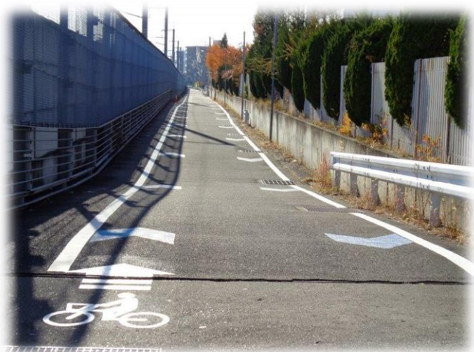
【矢羽根型路面標示設置】 (新幹線側道)