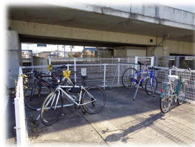
【サイクルスタンドの設置】 (北長野駅北口自転車駐車場)