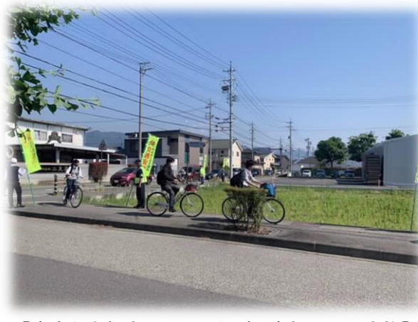
【安全な自転車利用につながる広報活動の実施】 (長野南高校前)