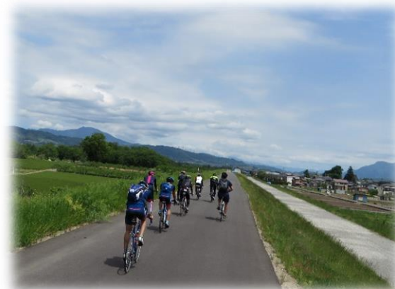
【千曲川サイクリングロード】