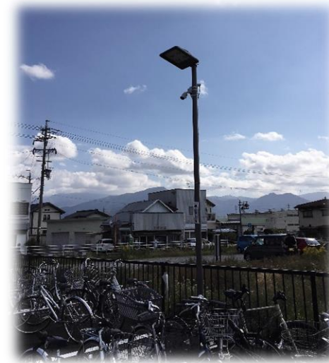
【防犯カメラの設置】 (朝陽駅自転車駐車場)