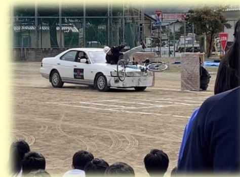
【世代に応じた交通安全教室】 （市内中学校）