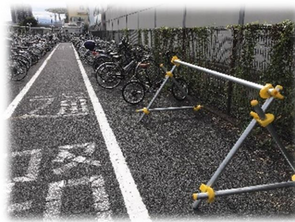
【サイクルスタンドの設置】 (長野駅東口自転車駐車場)