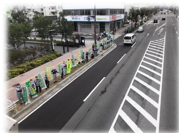
【交通安全運動を活用した街頭啓発活動の実施】 （市役所前）