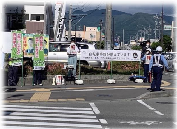
【安全な自転車利用につながる広報活動】 （東和田交差点）