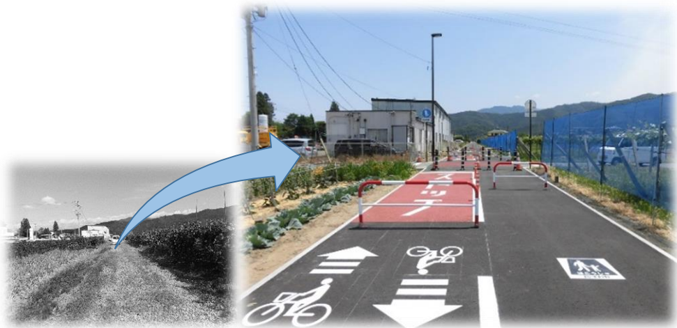
【千曲川新道 自転車道・遊歩道整備 (松代地区)】