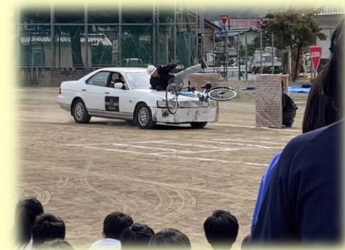
【世代に応じた交通安全教室】 (市内中学校)