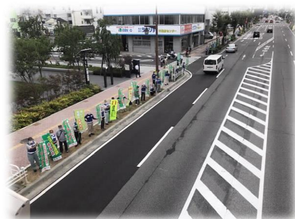
【交通安全運動を活用した街頭啓発活動の実施】 (市役所前)