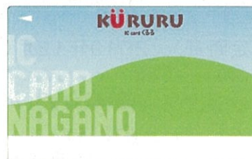
KURURUカード (一般、小児、障害者、介護者用)