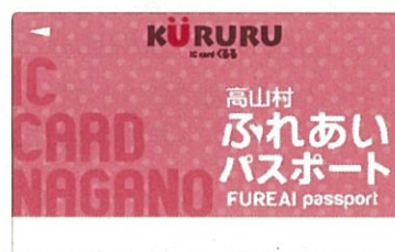
高山村ふれあいパスポート