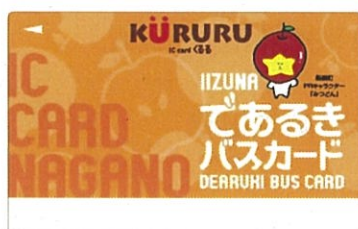
飯綱町IIZUNAであるきバスカード