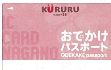
長野市おでかけパスポート