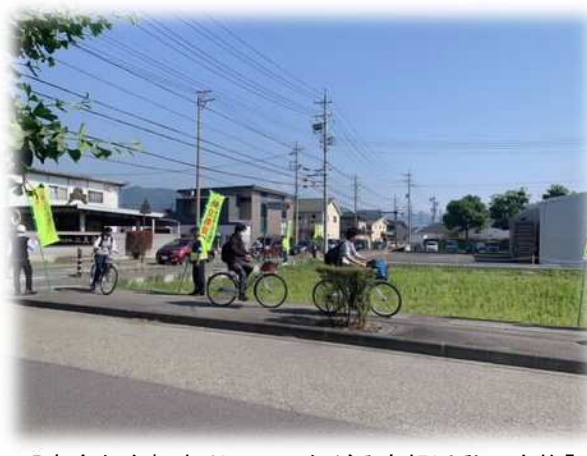
【安全な自転車利用につながる広報活動の実施】 (長野南高校前)