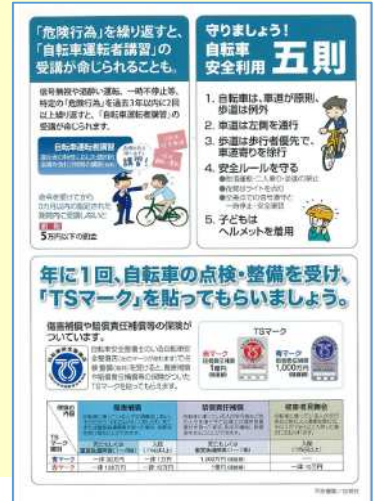
【自転車保険加入、点検・整備促進チラシ】