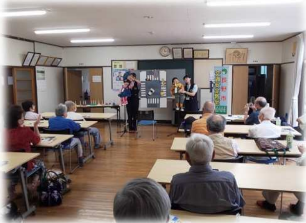
【世代に応じた交通安全教室の実施】 (地区老人クラブ)