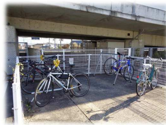
【サイクルスタンドの設置】 (北長野駅北口自転車駐車場)