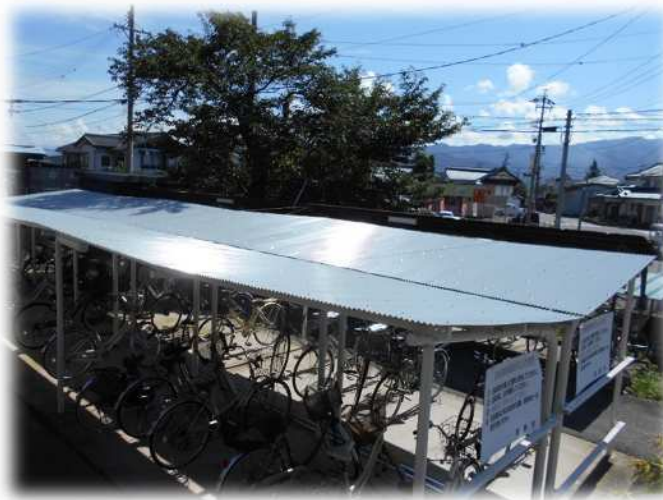
【駐輪場屋根の修繕】 (稲荷山駅自転車駐車場)