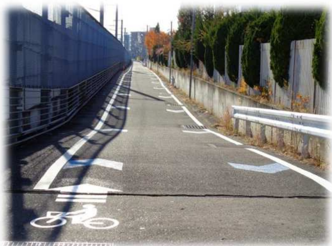
【矢羽根型路面標示設置】 (新幹線側道)